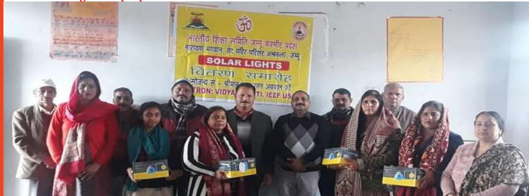
Solar Light Equipment Distribution in Thathi School -Udhampur