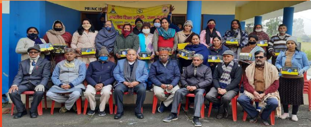
Solar Light Equipment Distribution in Hira Nagar