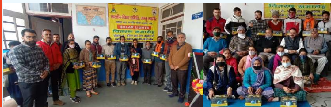
Solar Light Equipment Distribution in Ram Nagar School