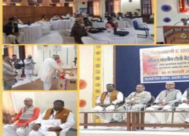
विद्याभारती E पाठशाला की अखिल भारतीय टोली बैठक सरस्वती विद्या प्रतिष्ठान हर्षवर्धन नगर भोपाल में आयोजित

इस कार्यक्रम जिसमें एकल सदस्यों द्वारा इ कर भाग लिया कार्यक्रम में स्कूल उधमपुर शर्मा ने बताया कि ज़रूरतमंद लोगों सोलर लाइट बांटे करने वाले छात्र जाने पर अपनी पढ़ाई कर सकें। उन्होंने का