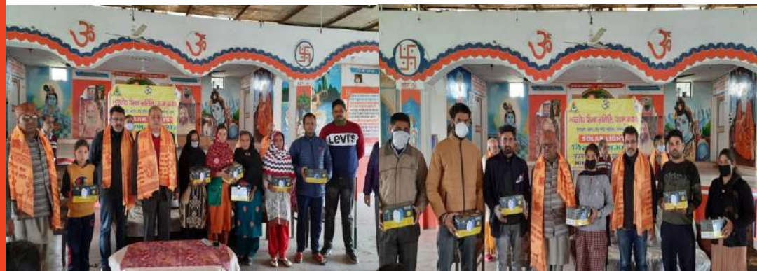
Solar Light Equipment Distribution in Param Dham Naunath Asram