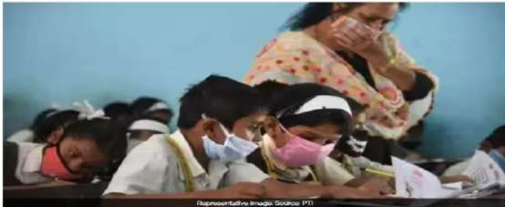
Representative image: Sohaia PT