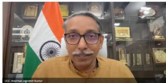
UGC chairman Jagadish Kumar

Engineering Book Discussion: First series of discussions will be first-year engineering books in Hindi, Odia, Marathi and second-year B.Tech books in English.