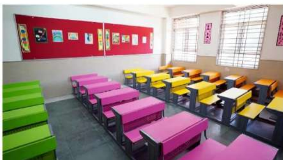
As a part of the agreement, both AICTE and CSTT will work towards evolving and defining scientific and technical terms

Box Office Report: Jawan Sets Bollywood Record With ₹ 65 Cr On Day 1