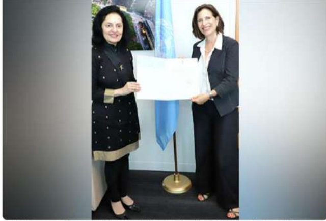
India's Permanent Representative to the UN, Ruchira Kamboj with Melissa Fleming, Under Secretary General of UN

India contributes USD 1,000,000 to promote Hindi language at United Nations