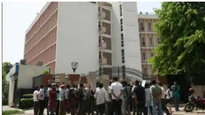
The UGC issued guidelines for celebrating the Utsav last week.

Bharatiya Bhasha Utsav is being celebrated on December 11 to create "language harmony" and develop a conducive environment for learning Indian languages