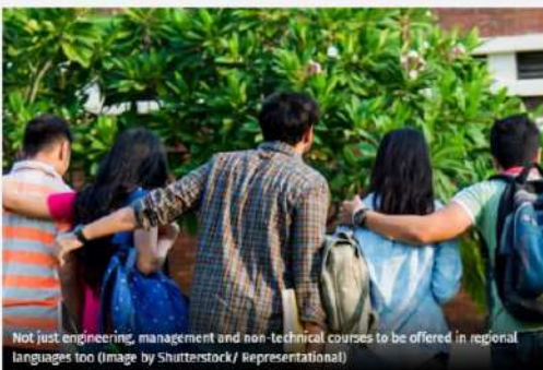
Not just engineering, management and non-technical courses to be offered in regional languages too (Image by Shutterstock/ Representational)

By: Education and Careers Desk • Trending Desk • Last Updated: AUGUST 09, 2021, 13:36 IST • New Delhi